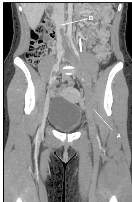
Figura 1. Reconstrucción axial de tomografía axial computada con contraste en fase arterial. (A) Extensa trombosis de venas femorales e ilíacas izquierdas, (B) Muestra extensión de la trombosis a la vena cava inferior en forma pediculada, no adherida a su pared (inestable).

Cuidados postoperatorios. Los pacientes son trasladados a su unidad de origen. De no existir contraindicación, la anticoagulación puede reiniciarse o mantenerse sin restricción. Se controló creatinina plasmática postinstalación del FVC.